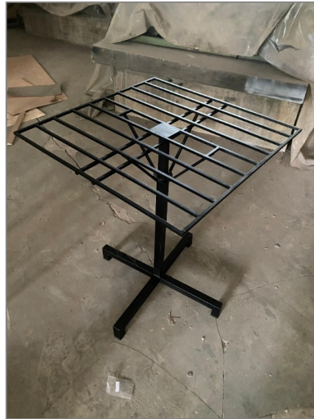
Gambar 3. Produk Meja Ca