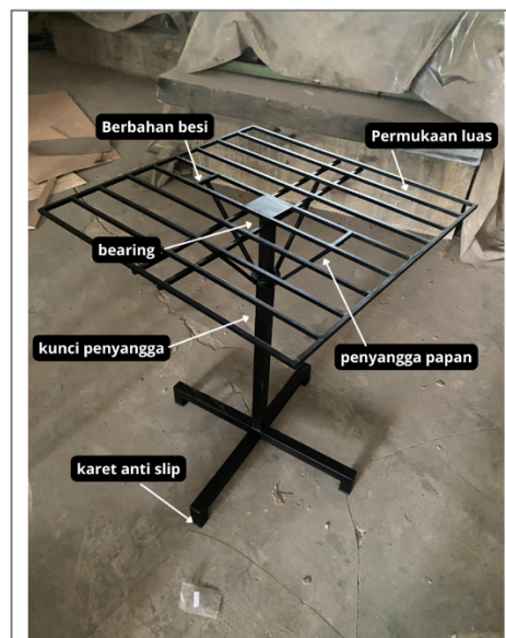
Gambar 4. Implementasi kata-kata kansei word dan hasil analisis Conjoint

Visualisasi hasil implementasi disajikan dalam Gambar 4. Implementasi Kansei Word dan Analisis Conjoint pada Produk Meja Cat.