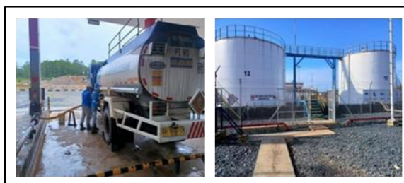
Gambar 2. Pembongkaran Fuel (bio solar) dari dan tangki penyetokan fuel (bio solar) PT PPA.

Berdasarkan tabel diatas menunjukan bahwa perusahaan PT Putra Perkasa Abadi (PT PPA) membutuhkan supplier/fendor fuel (bio solar) dari perusahaan PT Mandar ocean berjumlah 2 (dua) tangki/tandon berkapasitas total 1.000.000 liter untuk bahan bakar fuel (bio solar) digunakan untuk stok jika terjadi keterlambatan.