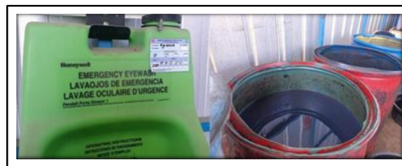
Gambar 6. Emergency Eyewash

Pada fuel storage ada 3 (tiga) tabung penyaring (filter) didalam aliran pipa tandon fuel (bio solar) ke tempat stock fuel truck, pergantian saringan (filter) dilakukan oleh karyawan PT Putra Perkasa Abadi setiap fuel (bio solar) kotor dengan catatan flowmeter telah melewati angka 1.000.000 atau pressure guage lebih dari 3-4 bar, dengan menggunakan kunci 19 Inch, 22 Inch, 24 Inch serta mekakai peralatan APD lengkap yaitu helm, kaca mata, masker dan sarung tangan. Kemudian filter yang bekas akan dikumpulkan ke tempat penampungan limbah B3 di Dept Plant. Pengolahan limbah cair B3 fuel bertujuan untuk mencegah dan menanggulangi pencemaran serta kerusakan lingkungan yang diakibatkan oleh limbah Cair B3 fuel PT Putra Perkasa Abadi.