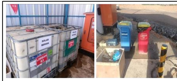
Gambar 4. Penampungan Limbah atau ceceran fuel (bio solar) dan tempat limbah padat.

Dalam pengolahan data, perusahaan PT PPA membuat atau melampirkan Material Safety Data Sheet (MSDS), terutama di area pembongkaran maupun di tempat stock yang digunakan untuk mencukupi SOP yang di buat oleh DEPT SHE yang dimana didalamnya terdapat penetapan aturan sebagai berikut: