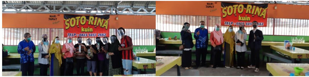
Gambar 7. Kegiatan Pemberdayaan Kelompok Warung Soto Banjar