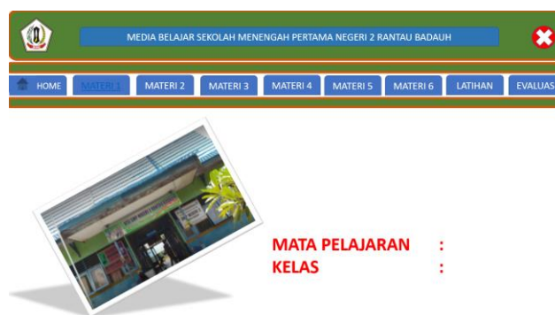
Gambar 1. Contoh Antar Muka Media Pembelajaran

Berikut contoh antar muka media pembelajaran dan soal untuk ujian yang telah dibuat :