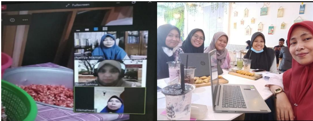
Gambar 10. Diskusi dilakukan setelah observasi awal dan data awal diperoleh.

dalam dunia bisnis UMKM yang dilaksanakan secara online dan offline . Diskusi dilakukan setelah observasi awal dan data awal diperoleh.