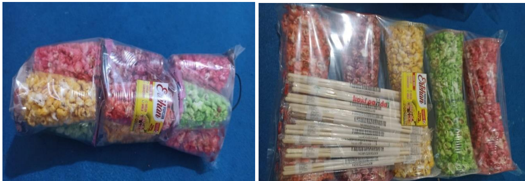
Gambar 4. popcorn yang dijual persatuan dan per bungkus

Produksi popcorn dilakukan berdasarkan pesanan dan produksi, dalam pengolahannya dilakukan sendiri oleh Bapak Syaifullah bersama dengan istri beliau, karena tidak ada karyawan yang membantu maka dalam membuat popcorn dilakukan disela-sela pengantaran pesanan jagung mentah popcorn . Hasil dari wawancara menggambarkan bahwa rata-rata perbulan, Erkan Popcorn ini menghabiskan sekitar 400 karung. Jumlah tersebut gabungan penjualan jagung mentah dan digunakan untuk membuat pesanan popcorn . Harga jual jagung mentah popcorn sekitar Rp520.000,00 dan penjualan popcorn perbungkus isi 10 gelas adalah Rp15.000,00