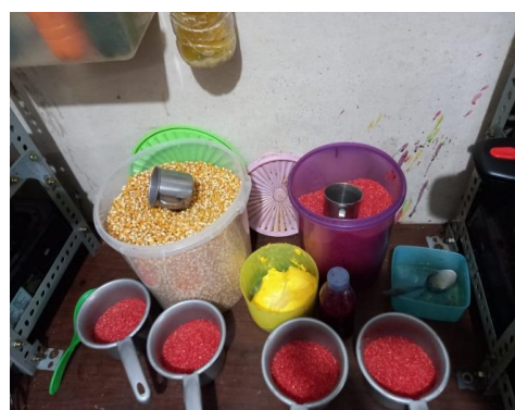
Gambar 6. Proses pendinginan