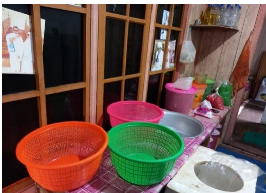
Gambar 5. Alat yang digunakan untuk pendingin

Dalam proses produksi pembuatan popcorn , beberapa alat digunakan secara sederhana dan manual seperti proses mendinginkan popcorn sebelum dilakukan pengemasan dan proses memasukan popcorn kedalam bungkus gelas.