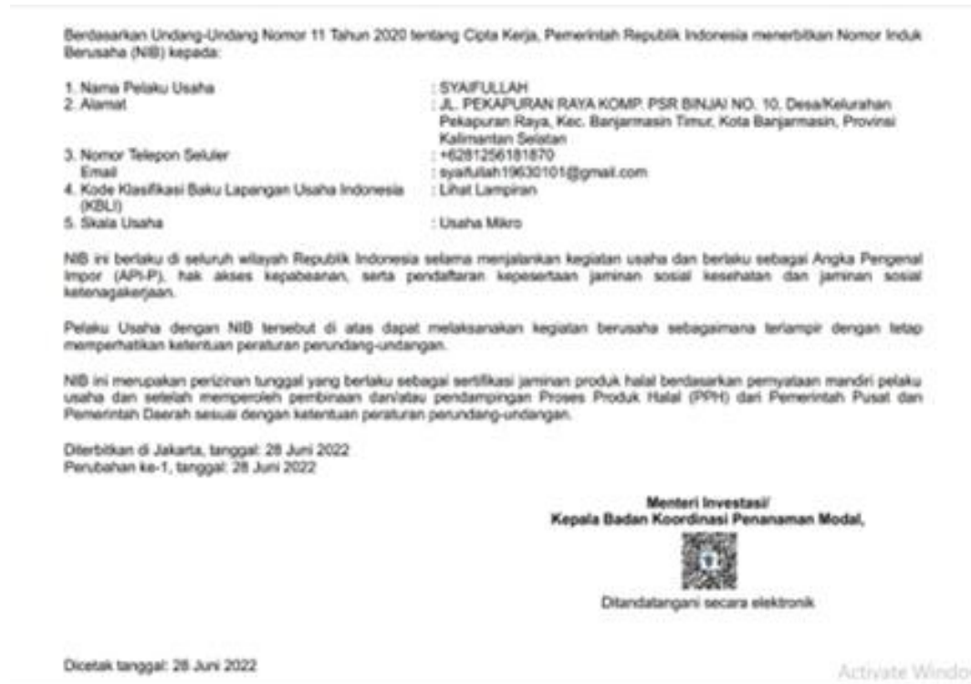
Gambar 14. Dokumen NIB Erkhan Popcorn

Tahap ini dengan seluruh rangkaiannya, semula direncanakan untuk sampai pada tahap pengurusan sertifikasi halal produk usaha Erkhan Popcorn. Akan tetapi ada kendala teknis yang membuat tahap tersebut tidak bisa lagi dilanjutkan (lihat sub bab berikutnya). Setelah sampai pada tahap terbitnya NIB, maka selesailah seluruh tahap pendampingan pada kegiatan pengabdian kali ini. Dokumen dimulai dari draf hingga keluar terbit dokumen aslinya sebagaimana yang terlihat pada gambar berikut: