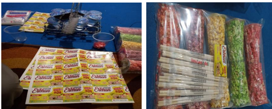
Gambar 8. Stiker label yang di tempelkan di plastik pembungkus produk

Popcorn yang diproduksi ada 12 rasa dan dalam pemasaran Erkhan Popcorn sudah memiliki label produk yang dicetak, namun dalam label tersebut masih belum ada standardisasi halal untuk produk tersebut. Bapak Syaifullah sudah pernah mencoba mengurus izin untuk memperoleh sertifikasi halal dan dokumen Nomor Induk Berusaha (NIB), namun karena pendaftaran dilakukan secara online, menyulitkan beliau untuk mendaftar, beliau memiliki kendala, dikarenakan belum begitu mengerti dengan teknologi dan beliau sangat mengapresiasi jika ada yang membantu dalam proses untuk mendapatkan dokumen Nomor Induk Berusaha (NIB) untuk produk Erkhan Popcorn .