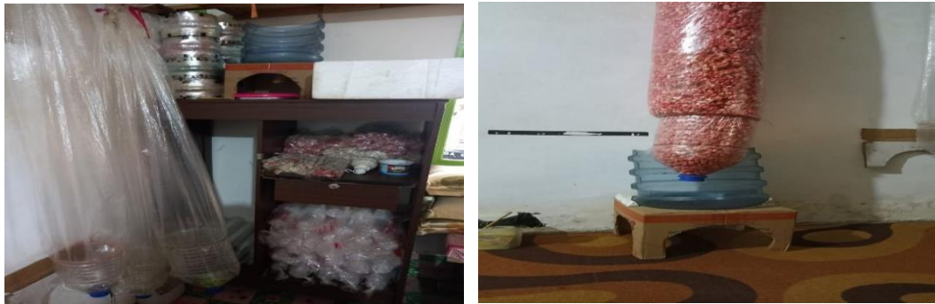
Gambar 7. Alat yang digunakan untuk menampung popcorn sebelum dimasukkan ke dalam gelas pembungkus

Popcorn yang diproduksi ada 12 rasa dan dalam pemasaran Erkhan Popcorn sudah memiliki label produk yang dicetak, namun dalam label tersebut masih belum ada standardisasi halal untuk produk tersebut. Bapak Syaifullah sudah pernah mencoba mengurus izin untuk memperoleh sertifikasi halal dan dokumen Nomor Induk Berusaha (NIB), namun karena pendaftaran dilakukan secara online, menyulitkan beliau untuk mendaftar, beliau memiliki kendala, dikarenakan belum begitu mengerti dengan teknologi dan beliau sangat mengapresiasi jika ada yang membantu dalam proses untuk mendapatkan dokumen Nomor Induk Berusaha (NIB) untuk produk Erkhan Popcorn .