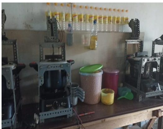
Gambar 2. Contoh alat produksi yang dijual

Erkhan Popcorn menjual alat produksi pembuatan popcorn dan jagung mentah sebagai bahan dasar pembuatan popcorn serta produk jadi popcorn. Jagung mentah bahan dasar popcorn yang dijual dengan kualitas unggul dari Filipina dan Amerika bukan jagung lokal sehingga sangat diminati oleh konsumen karena menghasilkan popcorn anti gagal.