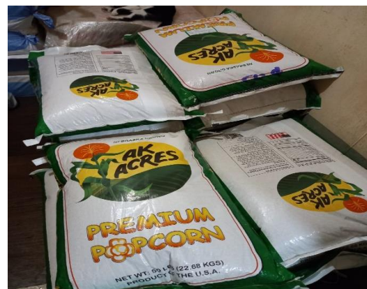
Gambar 3. jagung mentah bahan dasar popcorn