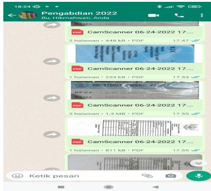
Gambar 12. Mengumpulkan dan menyiapkan dokumen untuk standarisasi produk usaha

Tahap ini dilakukan oleh tim 1, beberapa hari dimulai pada hari yang sama dengan hari pelaksanaan coaching . Bapak Syaifullah memberikan beberapa dokumen yang diperlukan sesuai dengan persyaratan pemberkasan. Dokumen yang diperlukan antara lain, fotokopi KTP, NPWP, KK, dan tanda tangan yang semuanya dalam bentuk digital (scan PDF/JPEG).