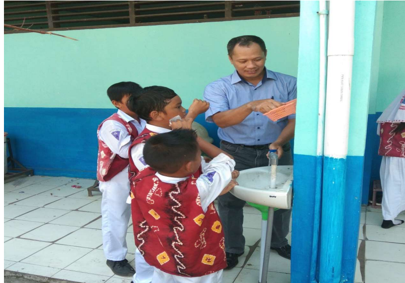
Gambar 6. Praktek

Praktek cuci tangan yang benar, bersih dan sehat serta hemat harus dicontohkan langsung agar siswa bertambah pengetahuan dan kesadarannya akan kebersihan diri dan kesehatan lingkungan sekolahnya.