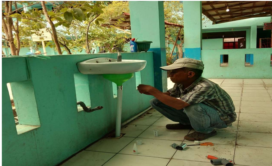
Gambar 4. Instalasi

Selain alat baru yang dipasang ada juga sebagian memperbaiki kondisi yang sudah ada semisal kebocoran dan tidak berfungsinya kran-kran air yang ada. Disini dibutuhkan kesabaran dan ketelitian dalam mengerjakan detail-detail alat dan bahannya.