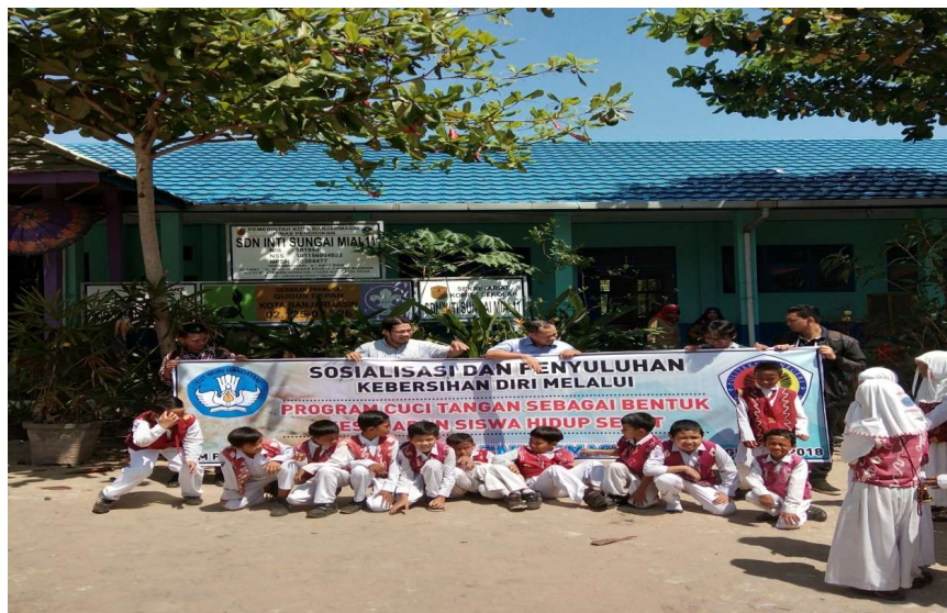
Gambar 5. Sosialisasi

Selain alat baru yang dipasang ada juga sebagian memperbaiki kondisi yang sudah ada semisal kebocoran dan tidak berfungsinya kran-kran air yang ada. Disini dibutuhkan kesabaran dan ketelitian dalam mengerjakan detail-detail alat dan bahannya.