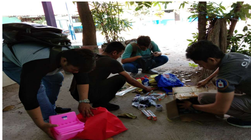
Gambar 3. Persiapan

Adapun kegiatan PPM berikutnya untuk skema kesadaran dan kesehatan masyarakat maka akan diperkuat pada sasaran selanjutnya yaitu jangka panjang yang akan ditentukan rumusan, program dan sarannya.