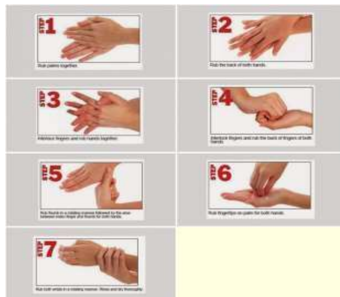
Gambar 1. Prosedur 7 langkah mencuci tangan