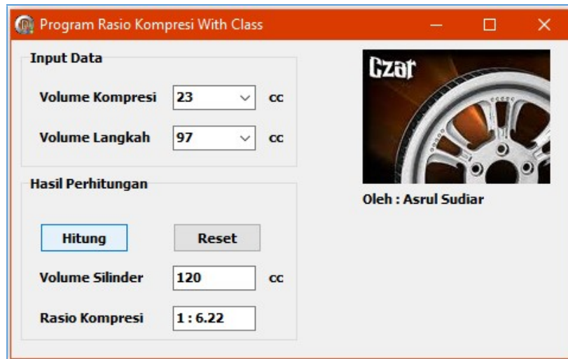
Gambar 4: Program Perhitungan Rasio Kompresi Mesin

Adapun hasil kegiatan selama praktek merancang aplikasi dibidang teknik mesin ini pada hari yang kedua dapat dilihat pada gambar berikut.