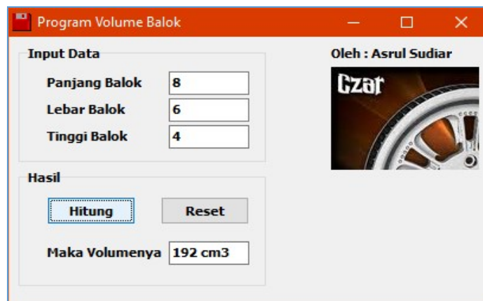
Gambar 2: Program Perhitungan Volume Balok

Pada kegiatan pelatihan ini, para peserta tidak hanya diberikan materi dasar yang berkaitan dengan dasar pemrograman teknik namun diberikan pula praktek merancang program atau aplikasi teknik dari awal sampai program aplikasi dapat dijalankan dengan baik. Adapun terdapat 4 aplikasi yang dikerjakan saat melaksanakan praktek saat pelatihan pemrograman aplikasi teknik seperti yang dapat dilihat pada gambar dibawah ini.