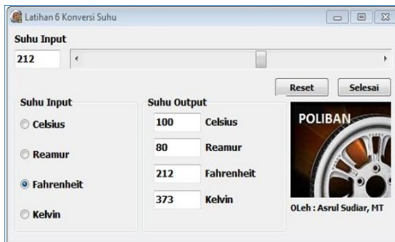
Gambar 5: Program Perhitungan Konversi Suhu Temperatur