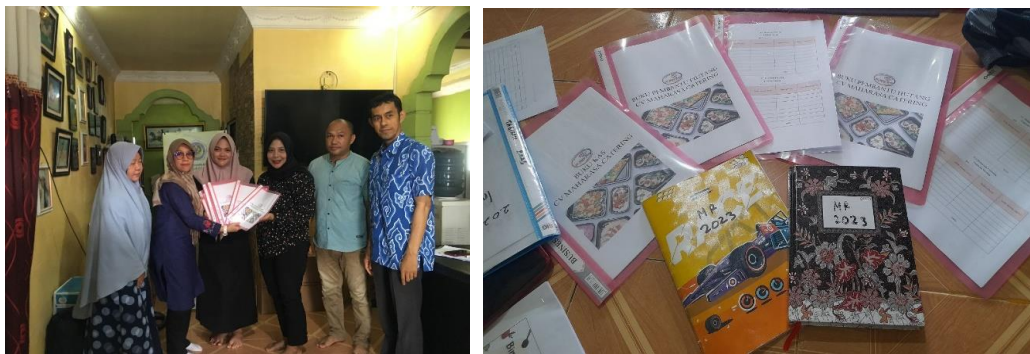
Gambar 3. Penyerahan Buku Kas, Buku Pembantu Piutang, Buku Pembantu Hutang, Laporan Piutang dan Laporan Hutang untuk CV Maha Rasa