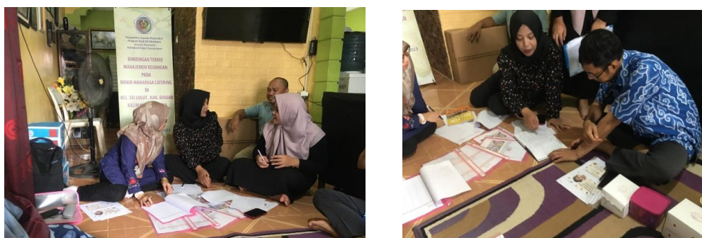
Gambar 2. Dokumentasi Bimbingan Teknis Manajemen Keuangan pada CV Maha Rasa

Tim pelaksana memberikan bimbingan teknis manajemen keuangan dengan terlebih dahulu memberikan gambaran dan pemahaman terkait manajemen keuangan, khususnya yang berkaitan dengan pencatatan keuangan pada Buku Kas, Buku Pembantu Piutang, Buku Pembantu Hutang, serta penyusunan Laporan Piutang dan Laporan Hutang menggunakan data keuangan bulan Mei 2023. Kemudian pemateri mempraktekkan dan memberikan contoh penggunaan pencatatan tersebut. Pemberi materi adalah tim dosen yang memiliki kepakaran di bidang manajemen keuangan dan akuntansi. Dokumentasi bimbingan teknis ini disajikan pada gambar 2.