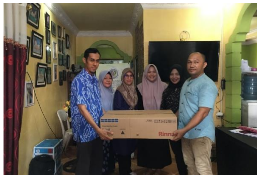
Gambar 4. Penyerahan Kompor Untuk CV Maha Rasa