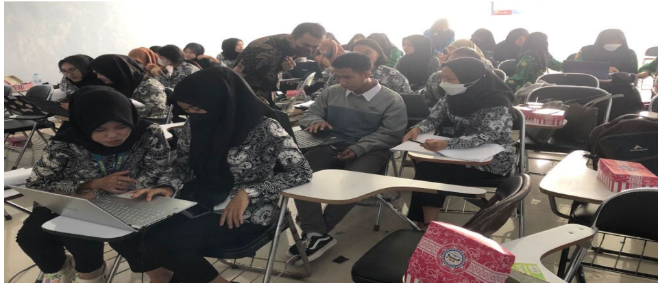
Gambar 1. Dokumen Kegiatan 1

Peserta pelatihan diberikan kesempatan untuk melakukan diskusi tentang permasalahan yang dialami terkait pengoperasian aplikasi Zahir Accounting .