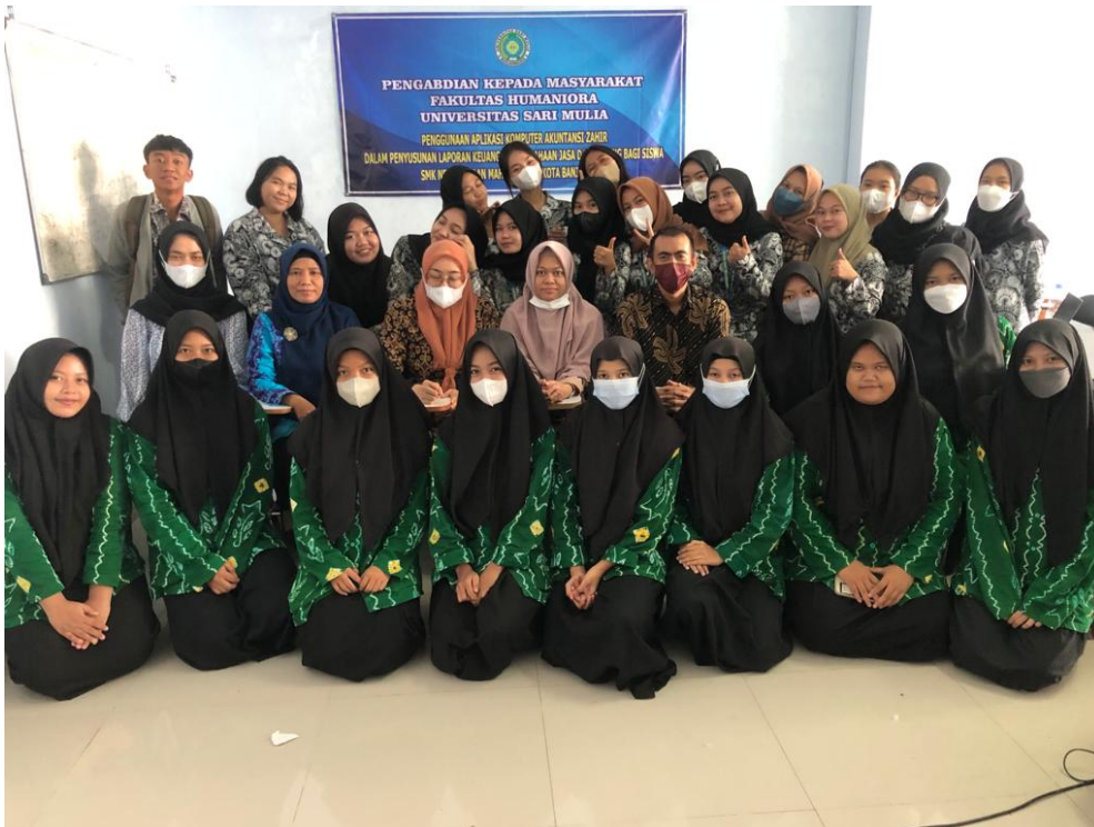
Gambar 4. Dokumen Kegiatan 4