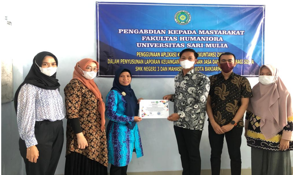
Gambar 3. Dokumen Kegiatan 3