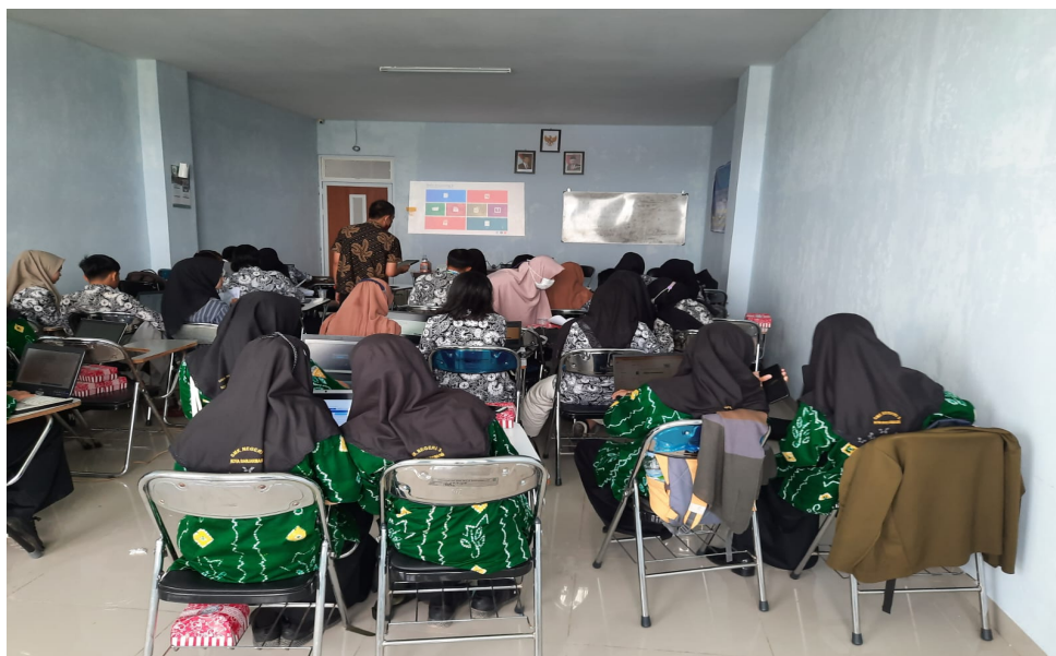
Gambar 2. Dokumen Kegiatan 2

Peserta kegiatan berasal dari SMK Negeri 3 Banjarmasin yang terletak di Jalan Pramuka No.52, RT.20/RW.03, Sungai Lulut, SMK ini merupakan salah satu sekolah yang cukup tua di Banjarmasin yang sebelumnya bernama SMEA Negeri 2 Banjarmasin yang terletak di daerah sungai lulut. Sedangkan Lokasi tempat pelatihannya berada di Universitas Sari Mulia di jalan Pramuka No. 02 Banjarmasin.