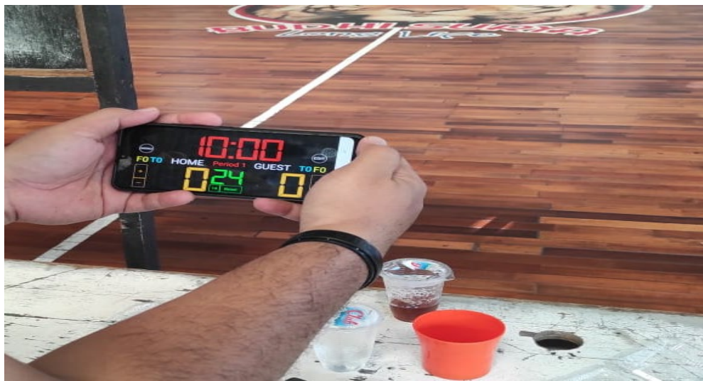
Gambar 8. Pengoperasian Sistem Scoreboard Digital Melalui Smartphone

Kegiatan pengabdian sangat maksimal dilaksanakan karena semua elemen dari score board digital berbasis android dapat langsung disimulasikan saat simulasi latihan tanding yang berlangsung disetiap sesi latihan. Dengan adanya aplikasi ini para tim kepelatihan sangat terbantu dengan simulasi game sesungguhnya dengan se detail mungkin karena adanya aplikasi sistem scoring board digital ini mulai dari timer, shootclock hingga pencatatan score yang sudah seperti pertandingan yang sesungguhnya yang membuat para pelatih bisa mencoba semua strategi dan patern bermain yang disesuaikan dengan simulasi timer, shootclock yang tentunya fasilitas itu ada pada aplikasi scoring board tersebut.