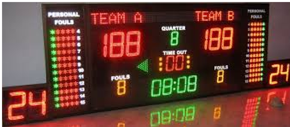
Gambar 4 Perangkat Scoreboard digital Bola Basket

Dengan ini kebutuhan akan score board digital akan semakin mudah didapatkan dan sangat efisien dari finansial serta bobot berat dan volumenya juga sangat praktis untuk dibawa dan disimpan.