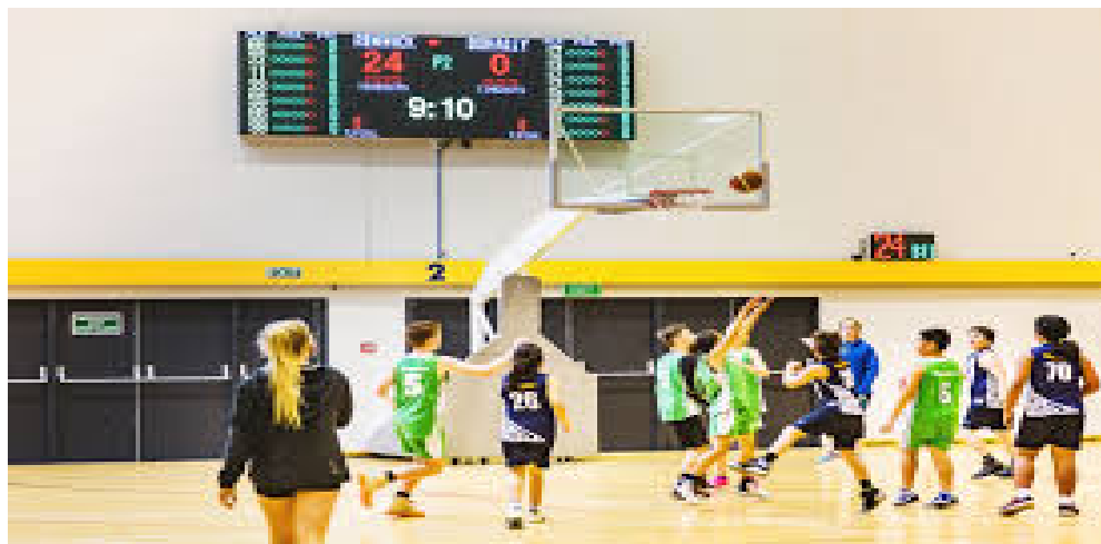
Gambar 2 perangkat Score Board Digital yang terpasang di sisi lapangan

Pada gambar 1 dan 2 diatas dapat dilihat bahwa besarnya perangkat score board yang seharusnya ada di setiap lapangan basket. Perangkat ini merupakan perangkat utama dalam setiap pertandingan, dan saat ini tidak semua klub bahkan pengurus olahraga basket dalam hal ini Perbasi yang mampu membeli perangkat score board tersebut karena harga nya yang relatif mahal dan tidak tersedianya vendor perangkat ini di Banjarmasin selaku ibukota kalimantan selatan sehingga harus membeli langsung ke Jakarta dan sekitarnya sehingga mengakibatkan biaya pengiriman yang juga relatif mahal mengingat volume dari perangkat tersebut yang sangat besar dan berat (Teguh Nuryadin et al. , 2019).