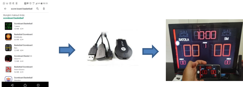
Gambar 6 Proses Instalasi Aplikasi Score board Digital

Berikut gambaran proses instalasi aplikasi score board digital berbasis desktop dan android :