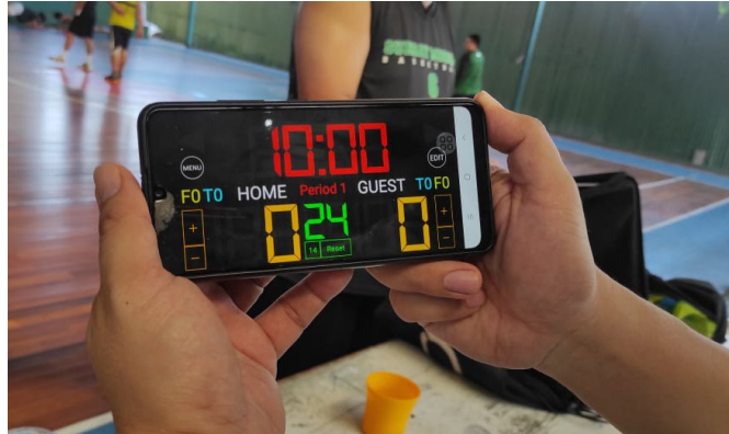
Gambar 5 Aplikasi scoreboard berbasis Android dan IOS

Pada gambar 4 dan 5 adalah perangkat sistem scoreboard digital bola basket yang tampilan dan menunya hampir sama, namun pada gambar 3 adalah perangkat scoreboard yang menggunakan program papan digital dengan sistem seven segmen dan menggunakan perangkat elektronik yang sangat besar dan instalasi serta biaya perawatan yang juga cukup besar yang mengakibatkan harganya juga sangat besar dengan kisaran 50-80 jutaan per unitnya.