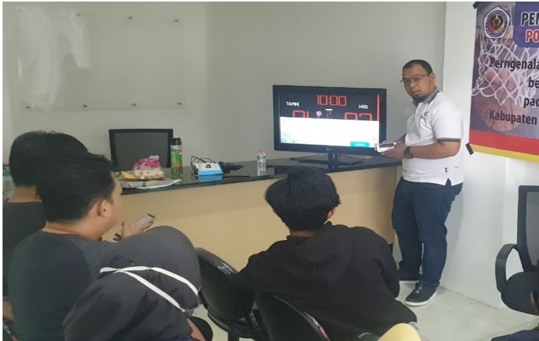
Gambar 9 Sosialisasi Instalasi Sistem Scoring Board Digital Berbasis Android dan IOS

Pada kegiatan pengabdian kepada masyarakat tersebut tim berkesempatan untuk langsung mengaplikasikan aplikasi score board digital bola basket pada program pemusatan latihan tim PORPROV Kota Banjarmasin yang juga turut dihadiri perwakilan pengurus Perbasi Provinsi Kalimantan Selatan dan Pengurus Perbasi Kota Banjarmasin. Pada kegiatan tersebut tim pengabdian langsung mensosialisasikan serta memberikan bimbingan teknis mulai dari perakitan, proses instalasi sampai penggunaan aplikasi score board digital.