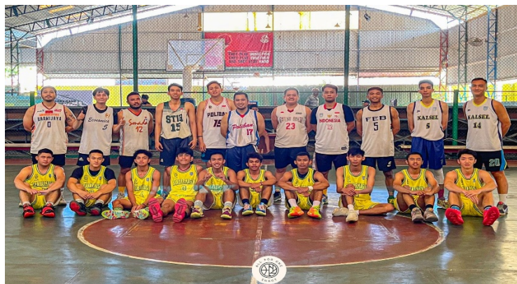
Gambar 7. Latih Tanding Tim PORPROV Kota Banjarmasin

Dalam kegiatan Pengabdian kepada masyarakat yang dilakukan pada pemusatan latihan tim bola basket Kota Banjarmasin untuk menghadapi Pekan Olahraga Provinsi (PORPROV) Kalimantan Selatan yang dilaksanakan selama 6 bulan di Lapangan basket Suria Arena Banjarmasin dan Gelanggang Olahraga Hasanuddin HM di Kota Banjarmasin. tim pengabdian memperkenalkan dan mensosialisaikan sistem penggunaan scoreboard digital berbasis desktop dan android, mulai dari cara searching aplikasi di google playstore dan aple store, proses instalasi ke smartphone hingga koneksi aplikasi tersebut dengan perangkat LED TV sebagai miroring atau smart screen yang menampilkan apa yang sedang dijalankan di smarthphone agar bisa terlihat lebih besar dan jelas disemua sisi lapangan basket