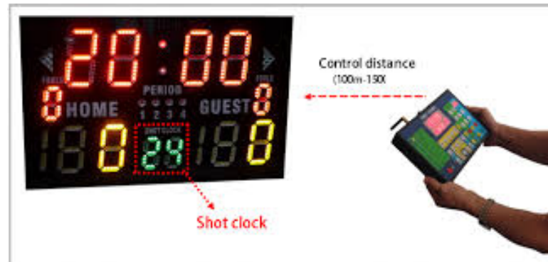
Gambar 1 Perangkat Score Board Digital