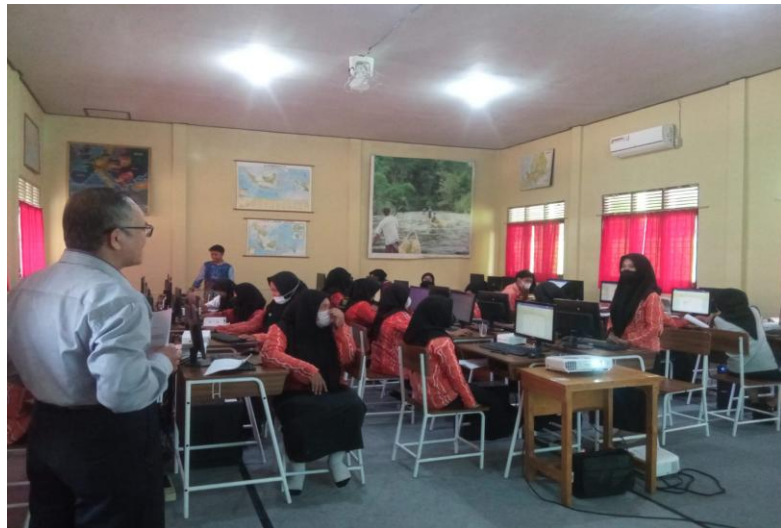
Gambar 4. Peserta memberi komentar materi pelatihan

Berdasarkan hasil pelaksanaan pelatihan penyusunan laporan teknis menggunakan microsoft word pada siswa SMK Negeri 3 Banjarbaru dapat disimpulkan sebagai berikut: