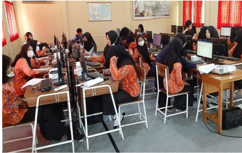
Gambar 3. Peserta mempraktikkan materi pelatihan