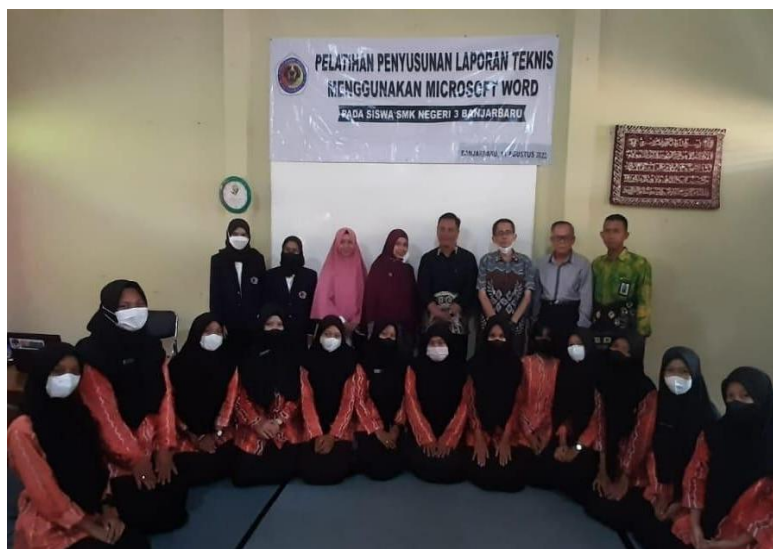
Gambar 5. Foto bersama tim pelaksana, guru dan siswa SMK Negeri 3 Banjarbaru