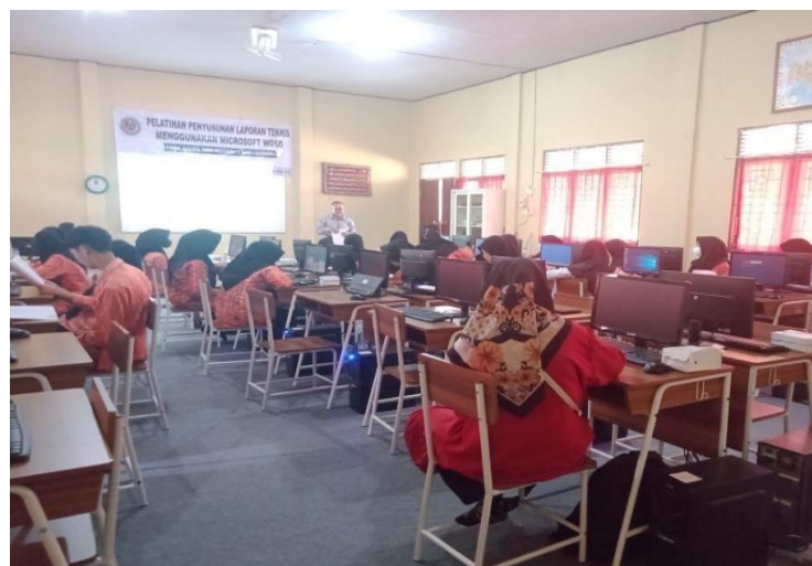
Gambar 2. Penyampaian materi penyuluhan kepada peserta

Pelatihan penyusunan laporan teknis menggunakan microsoft word pada siswa SMK Negeri 3 Banjarbaru ini diikuti oleh siswa sebagai peserta pelatihan sebanyak 19 orang. Tim pelaksana sebanyak 3 orang. Mahasiswa yang ikut tim pelaksana sebanyak 2 orang. Pelatihan dilaksanakan pertama dengan menggunakan metode ceramah dan tanya jawab berkenaan dengan penyampaian materi penyusunan laporan teknis. Kemudian, kedua, praktik penyusunan laporan teknis dengan menggunakan microsoft word.