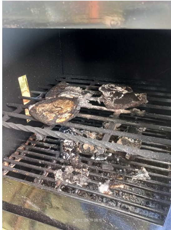
Gambar 8. Sisa hasil pembakaran limbah medis basah

Kendala yang dialami pada penggunaan insinerator ini adalah :