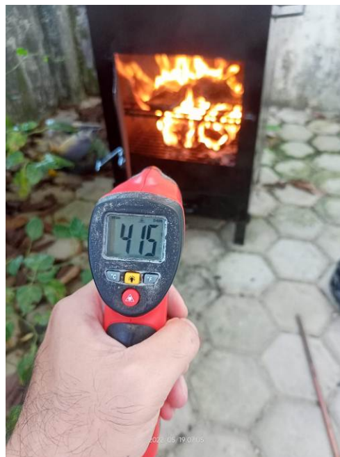
Gambar 7. Proses pengukuran temperatur ruang bakar