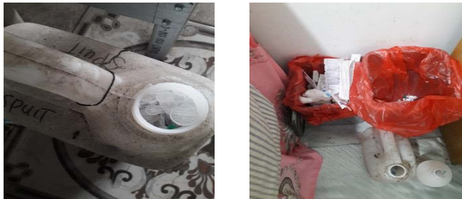
Gambar 1. Penumpukan Limbah Medis di PMB

Saat ini, pengelolaan limbah medis yang dilakukan oleh Bidan pada tahap pemilahan jenis limbah. Hal ini diakibatkan karena terbatasnya sarana dan prasarana yang dimiliki untuk melakukan proses lanjutan setelah pemilahan limbah medis. Situasi yang terjadi harus segera ditangani agar dapat meningkatkan kesejahteraan dan kesehatan masyarakat melalui penerapan dan pemanfaatan produk teknologi yang potensial dari Lembaga Litbang Perguruan Tinggi ke masyarakat.