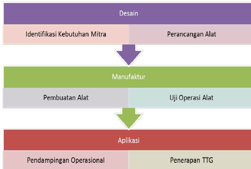
Gambar 2. Diagram Alir program penerapan TTG

dapat digunakan oleh mitra dengan baik. Tahapan penerapan TTG mengikuti diagram alir seperti ditampilkan pada gambar 2 berikut :