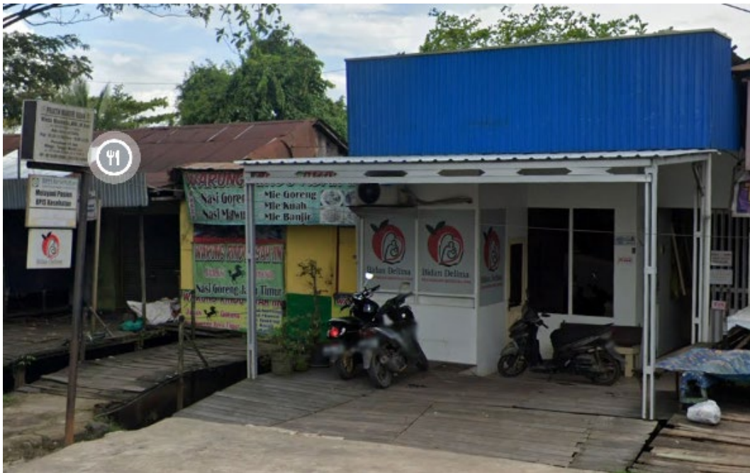
Gambar 4. Mitra PMB Winda di Banjarmasin

Berdasarkan hasil pengamatan dan wawancara dengan mitra, yaitu PMB Bidan Winda Maolida di Banjarmasin (Gambar 4), didapatkan bahwa limbah medis yang perlu diproses adalah berupa APD (sarung tangan, masker, dan celemek), berbahan dasar kain, karet, dan plastik), bahan penyerap cairan (popok, underpad, tisu, kain), dan kemasan obat (alat suntik, botol injeksi, kemasan obat minum, dan lain sebagainya). Dalam satu kali proses persalinan, bisa dihasilkan limbah medis dengan volume 1 plastik besar, dengan massa kira-kira 2kg.