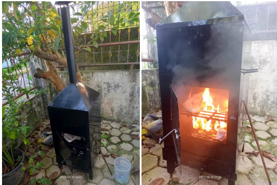
Gambar 6. Proses pembakaran

berubah menjadi gel yang sulit terbakar. Sisa hasil pembakaran limbah medis basah dapat dilihat pada gambar 8. Hasil ini berkesesuaian dengan kegiatan yang dilaksanakan pada insinerator sederhana, dimana proses pengelolaan sampah dengan menggunakan insinerator tersebut tidak bisa menyelesaikan permasalahan sampah secara sempurna (Rohman and Ilham, 2019).