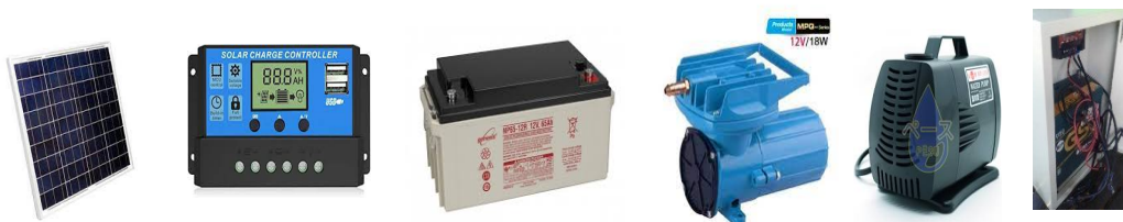
Gambar 7. Perangkat system control panel surya untuk sumber daya pompa, aerator dan lain-lain.

Peralatan ini mempunyai sistem penggerak panel surya yang akan memanfaatkan cahaya sebagai transfer energi sehingga jika malam akan digunakan maka aki merupakan tempat penyimpanan daya yang baik, sehingga peralatan ini dilengkapi dengan Aki 12 V dengan arus antara 65 A. agar perangkat stabil dalam pengisian dan pengeluaran arus, maka digunakan kontrol arus dari panel surya ke baterai, dan dari baterai ke aerator serta pompa.