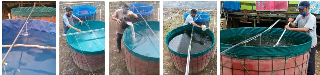
Gambar 9. Pengelohan media air kolam bioflok