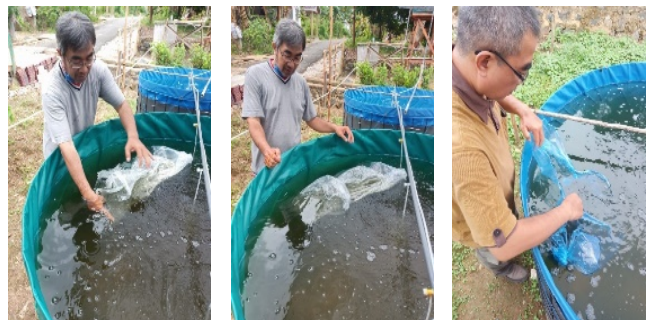
Gambar 10. Penebaran benih ikan lele

Penebaran benih hendaknya dilakukan pada pagi/sore hari. Pada kedua kondisi ini umumnya perbedaan nilai suhu air pada permukaan dan dasar kolam tidak terlalu besar. Jika perbedaan suhu air wadah benih dan air kolam tebar cukup signifikan, maka perlu dilakukan upaya penyamaan suhu air wadah benih secara bertahap terlebih dahulu agar benih tidak stres saat ditebarkan. Kedalaman air kolam tebar pun hendaknya disesuaikan dengan jumlah dan ukuran benih. Sedapat mungkin hindari penebaran benih pada kondisi terik matahari secara langsung. Sebaiknya benih ikan tidak ditebar langsung dari wadah ke kolam. Cara yang sering dilakukan adalah menenggelamkan sekaligus wadah dan benih ikan ke dalam kolam tebar secara hati-hati, perlahan dan bertahap. Benih ikan akan mendapat kesempatan beradaptasi (walau sebentar) dengan lingkungan air kolam tebar sedini mungkin meskipun masih berada dalam wadahnya. Kemudian benih ikan dibiarkan keluar sendiri-sendiri dari wadahnya secara bertahap menuju lingkungan air kolam tebar yang sesungguhnya.