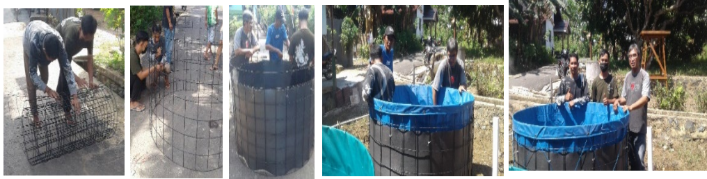
Gambar 5. Perakitan Terpaulin fish