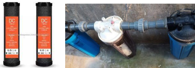
Gambar 8. Perangkat Filter air sungai yang terdiri filter sedimen dan filter Karbon

Selain itu, agar air tetap terus terpenuhi maka menggunakan sistem otomatis yang akan menghidupkan pompa disaat tandon berada kondisi kosong. Sebagai bagian proses penjernihan air sungai, maka sebelum tandon dipasang filter sedimen agar dapat menyaring air dan air di dalam tandon merupakan air yang relatif jernih. Kemudian dari tandon menuju kolam akan terpasang filter carbon aktif yang akan memastikan air masuk dalam kolam adalah air telah tersaring kandungan mineral kimianya.