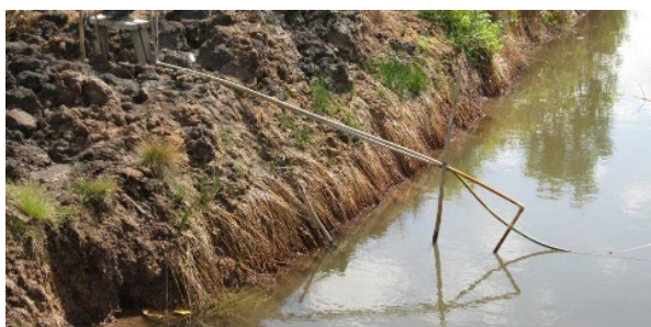
Gambar 1. Kondisi Air di Bantaran Sungai Kemuning Banjarbaru

Hasil pengujian kualitas air sungai Martapura oleh BAPEDALDA Kabupaten Banjar yang bekerja sama dengan Balai Riset dan Standarisasi Industri Kalimantan Selatan pada bulan januari 2017 memperlihatkan bahwa kondisinya telah tercemar, baik secara fisika, kimia, maupun biologi. Hal ini ditunjukkan dengan kandungan TSS 224 mg/l, COD 15,4 mg/L, dan BOD 7,5 mg/L, yang telah melebihi ambang batas peruntukan dan baku mutu air kelas I berdasarkan Peraturan Gubernur Kalimantan Selatan No.05 tanggal 29 Januari Tahun 2007. (BAPEDALDA,2007). Sehingga asumsi bahwa pencemaran air di sungai daerah Kalimantan Selatan pun dapat terjadi.