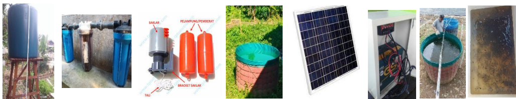
Gambar 4. Perangkat Smart Tarpaulin Fish dan budidaya ikan tawar

Observasi dilakukan untuk mengetahui kondisi sumber air yang akan digunakan, jarak sumber air dengan kolam, kondisi kebutuhan tenaga surya, dan sebagainya. Hal ini dilakukan untuk dapat menghitung perangkat yang dibutuhkan, perhitungan jumlah aliran listrik yang akan digunakan, hingga jenis ikan yang akan dibudidayakan.