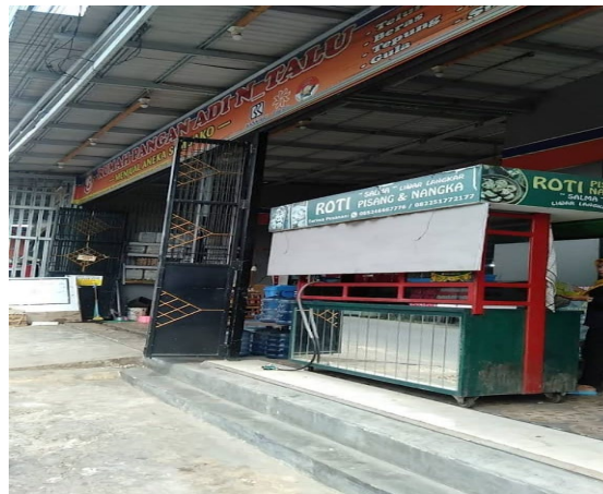
Gambar 2. Di Daerah Kelayan A Banjarmasin

Berikut adalah dokumentasi kegiatan Pengabdian kepada Masyarakat: