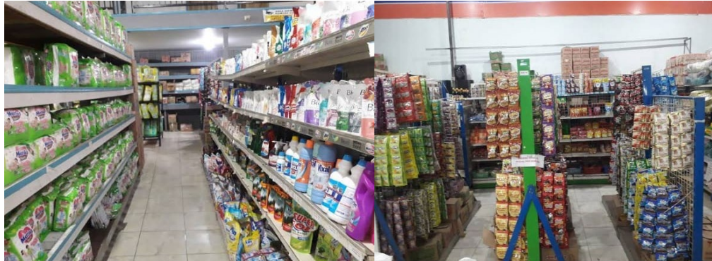
Gambar 4. Contoh Persediaan Barang Dagangan Yang Akan dihitung