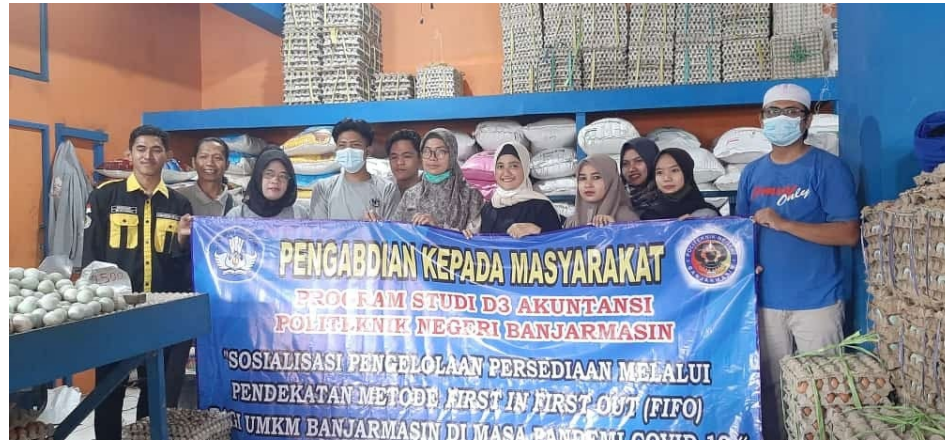
Gambar 7. Foto Bersama Peserta