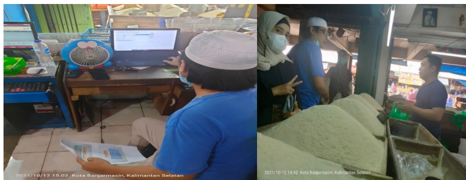
Gambar 6. Diskusi dan pembimbingan penghitungan persediaan secara langsung