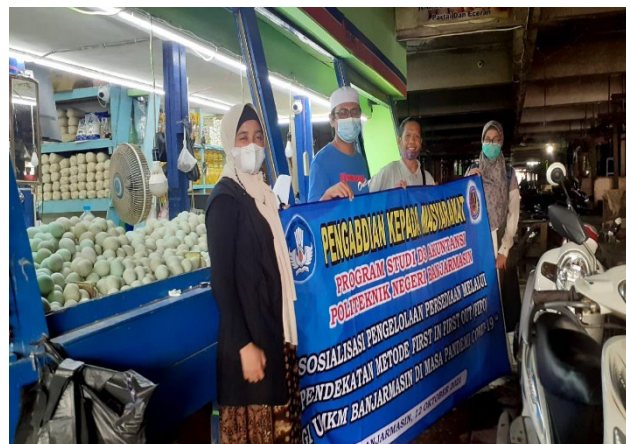
Gambar 3. Toko Di Pasar Hanyar Antasari Banjarmasin