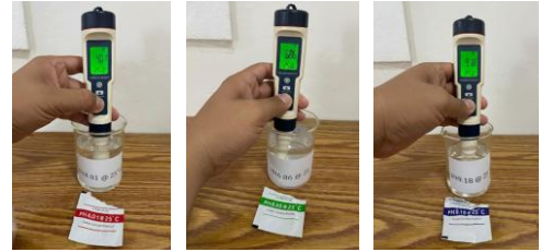
Gambar 6. Pengujian Kalibrasi sebelum alat dihunakan