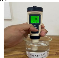
Gambar 13. Pengujian TDS pada perumahan A dengan atap material Genteng

Hasil pengukuran menunjukkan nilai Zat Padat Terlarut TDS pada sampel air hujan dari atap genteng adalah 18 mg/liter