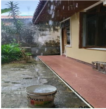
Gambar 3. Proses Penampungan Air Hujan dari atap Material Genteng