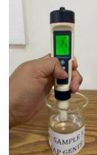
Gambar 7. Pengujian pH dan suhu pada perumahan A dengan atap material Genteng

Dari gambar di atas dapat disimpulkan bahwa Pengujian pH dan suhu pada perumahan A dengan atap material Genteng mendapatkan hasil pH 2.2 dan suhu 22 °C.