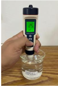
Gambar 14. Pengujian TDS pada perumahan B dengan atap material Seng Alkan

Hasil pengukuran menunjukkan nilai Zat Padat Terlarut TDS pada sampel air hujan dari atap Seng Alkan adalah 25 mg/liter