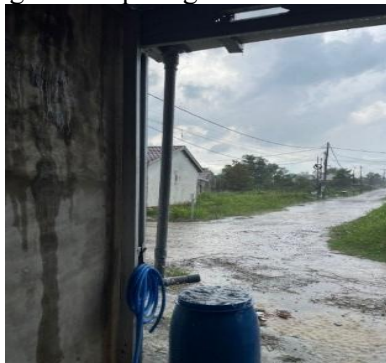
Gambar 5. Proses Penampungan Air Hujan dari atap Material Seng Galvanis