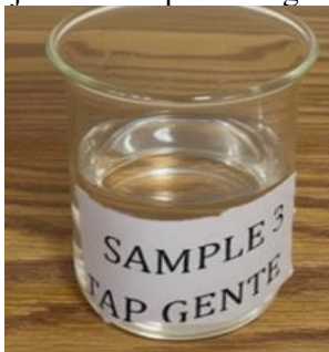
Gambar 10. Pengujian bau dan rasa pada atap material genteng

Dari hasil pengujian sampel air hujan atap material genteng dapat dinyatakan tidak berbau dan tidak berasa.