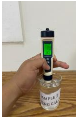
Gambar 9 Pengujian pH dan suhu pada perumahan C dengan atap material Seng Galvanis

Dari gambar di atas dapat disimpulkan bahwa Pengujian pH dan suhu pada perumahan C dengan atap material Seng Galvanis mendapatkan hasil pH 1.2 dan suhu 26 °C.