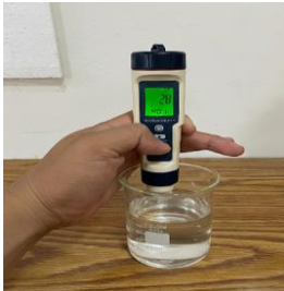
Gambar 15. Pengujian TDS pada perumahan C dengan atap material Seng Galvanis

Hasil pengukuran menunjukkan nilai Zat Padat Terlarut TDS pada sampel air hujan dari atap Seng Alkan adalah 28 mg/liter