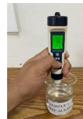
Gambar 8 Pengujian pH dan suhu pada perumahan B dengan atap material Seng Alkan

Dari gambar di atas dapat disimpulkan bahwa Pengujian pH dan suhu pada perumahan B dengan atap material Seng Alkan mendapatkan hasil pH 1.31 dan suhu 25 °C.