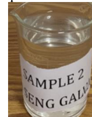
Gambar 12. Pengujian bau dan rasa pada atap material seng ganvanis

Dari hasil pengujian sampel air hujan atap material seng galvanis dapat dinyatakan tidak bau dan tidak berasa.