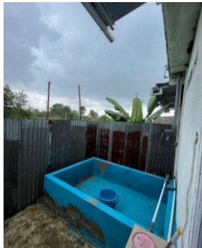
Gambar 4. Proses Penampungan Air ujan dari atap Material Seng Alkan