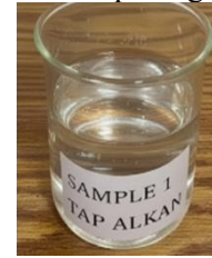
Gambar 11. Pengujian bau dan rasa pada atap material seng alkan

Dari hasil pengujian sampel air hujan atap material seng alkan dapat dinyatakan tidak berbau dan tidak berasa.