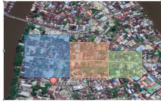
Gambar 2. Peta Catchment Area

Dalam penentuan periode ulang tinggi hujan rencana, diperlukan data luas catchment area terhadap drainase yang ditinjau. Berikut perhitungannya :