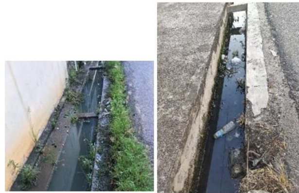
Gambar 1. Saluran Drainase Eksisting

Kota Banjarmasin merupakan wilayah yang penduduknya cukup padat khususnya pada Jalan Simpang Sungai Mesa, sering terjadi adanya genangan di jalan saat hujan (saluran drainase meluap) sehingga mengganggu aktivitas masyarakat yang melintas pada jalan tersebut. Dengan kejadian tersebut perlu adanya perancangan ulang pada dimensi saluran drainase (tinggi saluran). Pada saat musim hujan muncul masalah, yaitu genangan air di jalan yang diakibatkan oleh air hujan yang tidak mengalir dengan baik. Hal ini disebabkan adanya sampah di saluran yang menyumbat aliran air hujan. Selain itu juga perlu perhitungan ulang dimensi saluran drainase. Oleh karena itu perlu dilakukan pengukuran pada dimensi saluran kondisi eksisting untuk analisa kapasitas saluran drainase dengan memperhitungkan pengaruh debit hujan periode ulang tertentu. Foto-foto saluran eksisting diperlihatkan Gambar 1.