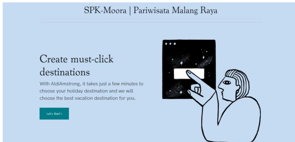
Gambar 2. Tampilan Awal

Pada tampilan awal user dapat klik button untuk dapat mengisi form.