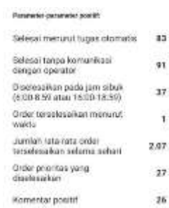
Gambar 1. Evaluasi pesan informasi pada Maxim Driver

Suatu sistem harus selalu menginformasikan pengguna (user) tentang apa yang sedang berlangsung. Jika ada sesuatu yang terjadi, pihak developer mengirimkan informasi terkait capaian kepada driver Maxim (Gambar 1).