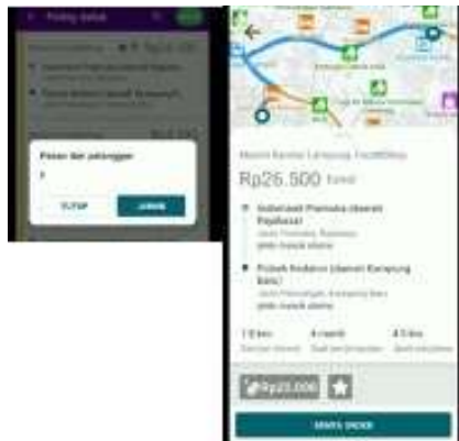
Gambar 3. User Interface Pemesanan Maxim Driver