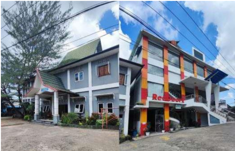
Gambar 1. LKSA dan Guest House Sentosa

Hasil penelitian menunjukkan bahwa LKSA Sentosa Banjarmasin menerapkan pola pengelolaan dana yang tidak hanya bertumpu pada dana sosial, tetapi juga mengembangkan sumber pendapatan melalui usaha produktif. Dana sosial seperti donasi tetap menjadi bagian dari sistem keuangan lembaga, namun telah dilengkapi dengan pendapatan mandiri dari unit usaha yang dikelola secara berkelanjutan. Strategi ini mencerminkan adanya pergeseran paradigma dari pengelolaan dana yang bersifat konsumtif menuju pendekatan yang lebih produktif dan berorientasi jangka panjang.