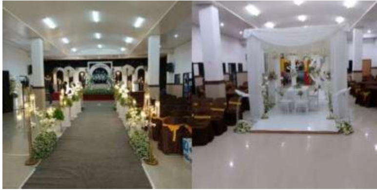
Gambar 2. Gedung serbaguna

Pola ini menunjukkan bahwa lembaga mampu membaca peluang ekonomi di lingkungan sekitarnya dan mengonversinya menjadi sumber pendapatan yang produktif. Temuan ini mengindikasikan bahwa pengelolaan dana produktif tidak hanya berfungsi sebagai pelengkap, tetapi telah menjadi bagian strategis dalam sistem keuangan lembaga.