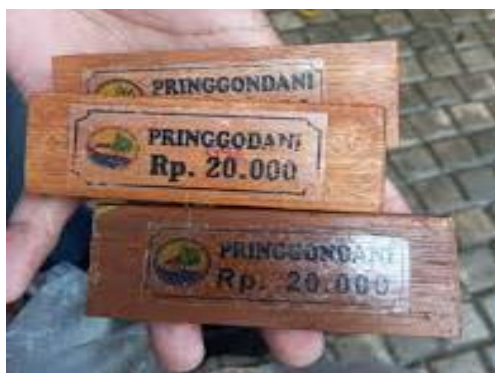
Gambar 2. Uang Kayu

Uang kayu berfungsi sebagai token atau alat pembayaran sementara yang digunakan dalam transaksi bernilai kecil. Pedagang memberikan uang kayu kepada pembeli sebagai tanda bahwa transaksi telah terjadi, dan pencairan atau penyelesaian transaksi dilakukan pada akhir hari atau sesuai kesepakatan antara pedagang dan pembeli.