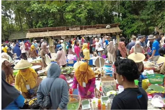
Gambar 1. Pasar Tumpah Pringgodani Balikpapan

Fenomena penggunaan uang kayu dapat dikaji melalui perspektif inovasi frugal, yakni bentuk inovasi yang muncul sebagai respons atas keterbatasan sumber daya namun tetap mampu memberikan solusi yang efektif dan efisien (AZIZ, 2024). Dalam konteks pasar tradisional, uang kayu mencerminkan kemampuan kreativitas lokal dalam menghasilkan solusi praktis tanpa memerlukan dukungan teknologi canggih maupun investasi modal yang besar (Nuraini, 2024). Selain berfungsi sebagai alat pembayaran sementara, sistem uang kayu juga memiliki implikasi terhadap pengelolaan modal kerja pedagang. Modal kerja mencakup unsur kas, persediaan, serta piutang jangka pendek yang perlu dikelola secara optimal agar aktivitas operasional harian dapat berlangsung secara berkelanjutan (Difinubun & Kaharudin, 2024). Melalui penggunaan uang kayu, pedagang terbantu dalam mengatur arus kas harian karena dapat mengurangi penggunaan uang tunai secara langsung serta mempermudah pencatatan transaksi hutang-piutang bernilai kecil antar pelaku pasar. Meskipun demikian, penerapan sistem ini juga mengandung sejumlah risiko, seperti potensi kehilangan token, kesalahan dalam pencatatan manual, serta tingginya ketergantungan pada kepercayaan antar pedagang.