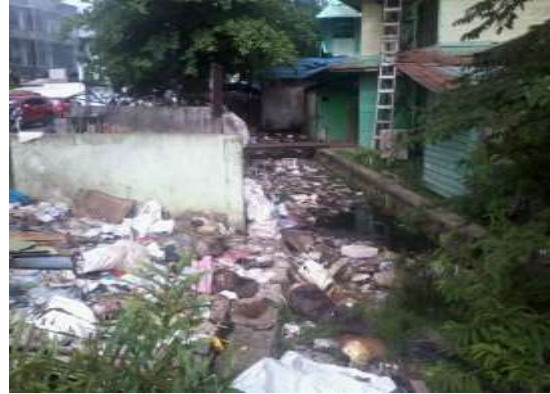
Gambar 3. Kondisi Sungai Veteran pada Sta 23 (1+115)

menyebabkan sampah menumpuk dan menjadi sedimen yang mengakibatkan pendangkalan sungai Veteran.