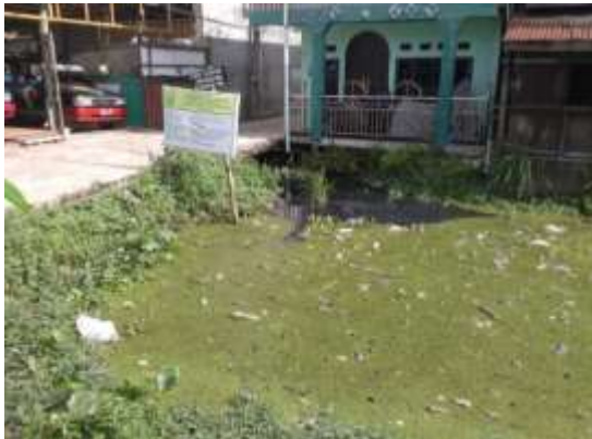
Gambar 2. Kondisi Sungai Veteran pada Sta 22 (1+065)

Pada titik Sta 15 terjadi penyempitan badan sungai yang berakibat pengurangan kapasitas tampungan sungai Veteran, dan adanya bangunan jalan menghambat aliran air pada sungai Veteran.