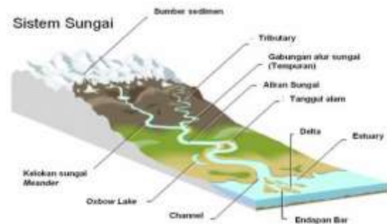
Gambar 1 Sistem Sungai

tenaga listrik, pelayaran, pariwisata, perikanan dan lain-lain. Dalam bidang pertanian sungai itu berfungsi sebagai sumber air yang penting untuk irigasi (Sosrodarsono, 2006).