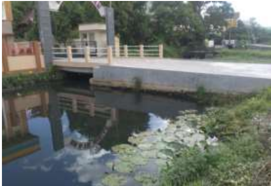
Gambar 1. Kondisi Sungai Veteran pada Sta 15 (0+705)

Penampang pada titik Sta 0 cukup besar untuk menampung debit aliran air baik itu akibat air hujan dan/atau pasangannya air laut, dan cukup memadai sebagai saluran primer untuk jaringan drainase kota Banjarmasin. Akan tetapi masih ada tumpukan sampah pada bantaran sungai yang mengakibatkan terganggunya aliran permukaan sungai Veteran.