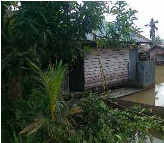
Gambar 8. Bangunan daerah Sungai Lulut

Keterangan : Bangunan ini berada di daerah sungai lulut dengan dimensi Panjang = 10 m dan Lebar = 5 m, dengan kondisi bangunan 9m badan bangunan masuk ke dalam arah sungai, Untuk daerah sungai ini kondisi bangunan di sisi kiri kanan sungai sama yaitu sebagian badan bangunan berada di atas sungai