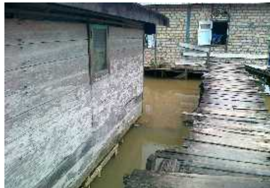
Gambar 7. Bangunan daerah Sungai Gardu