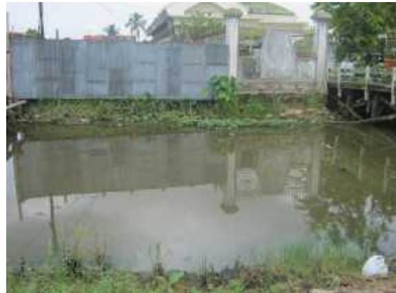
Gambar 11. Sungai Batas Belitung Darat