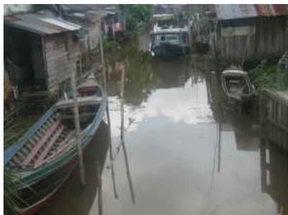
Gambar 12. Sungai Banyuur