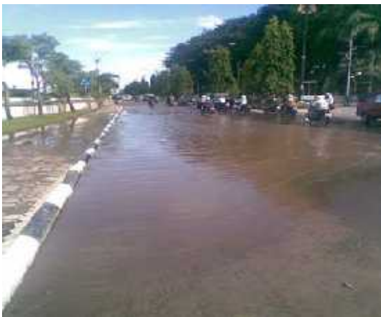
Gambar 5. Genangan Air Depan Mesjid Sabilal Muhtadin

Genangan air Kecamatan Banjarmasin Timur terjadi di 5 titik yaitu di sebagian jalan Keramat yang terletak persis di depan sebuah Sekolah Dasar (SD) dan jalan Manggis yang disebabkan sungai semakin sempit. Genangan juga terdapat di jalan Beringin (samping jembatan) disebabkan melimpasnya air sungai ke jalan karena sungainya tidak berfungsi dengan baik karena terdapat banyak sampah yang mengakibatkan sungai mengalami penurunan fungsi, jalan Ratu Zaleha tidak luput dari genangan karena sungainya yang mati.