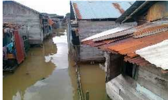
Gambar 6. Bangunan rumah daerah sungai bilu

Keterangan : Bangunan di atas merupakan bangunan yang mempunyai dimensi panjang = 10 m dan lebar = 6 m, dengan kondisi bangunan seluruhnya berada di atas sungai. Untuk daerah sungai ini kondisi bangunan disisi kiri kanan sungai sama yaitu berada tepat diatas sungai