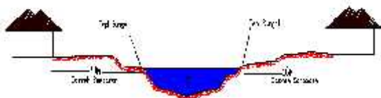
Gambar 2. Sempadan sungai untuk kedalaman sungai 3m