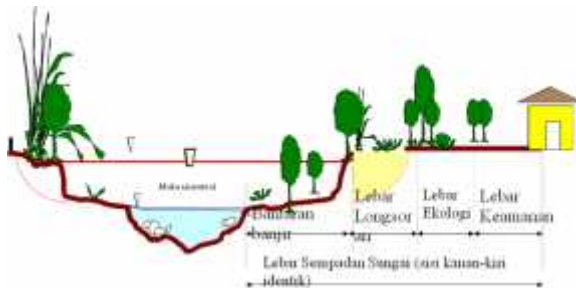
Gambar 1. Sempadan Sungai