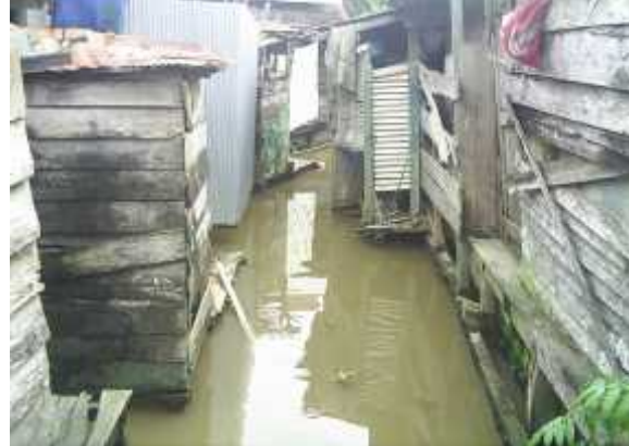
Gambar 9. Bangunan daerah Sungai Kuripan

Keterangan : Bangunan ini berada di daerah Sungai Kuripan, dengan dimensi Panjang = 12 m dan Lebar = 7 m, dengan kondisi badan bangunan 2 m masuk kedalam arah sungai, Untuk daerah sungai ini kondisi bangunan di sisi kiri sebagian masuk ke arah sungai, sedangkan untuk sisi kanan sungai, bangunannya berada pada tepi sungai.