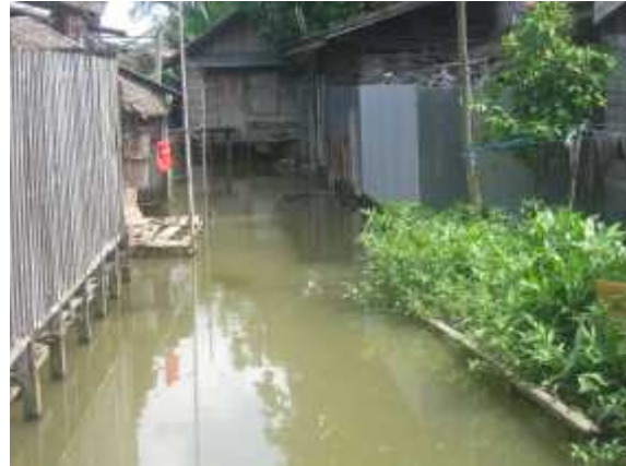
Gambar 10. Sungai Landas